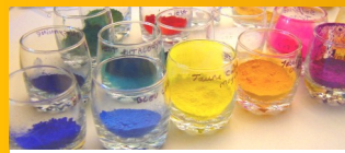
Pigments: poudres de couleur finement broyées

« D évelopper et diffuser, plus particulièrement la technique de la peinture a tempera (à l'œuf) et l'histoire de son utilisation (notamment au cours du moyen-âge et pour les icônes). »